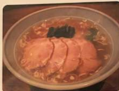
チャーシューメン 950円