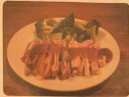
ホルモンプラスワン 500円