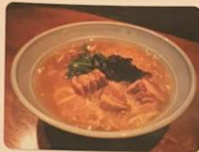
ハルピンラーメン 950円