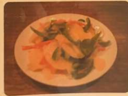
ピーマンとジャガイモのあえ物 500円