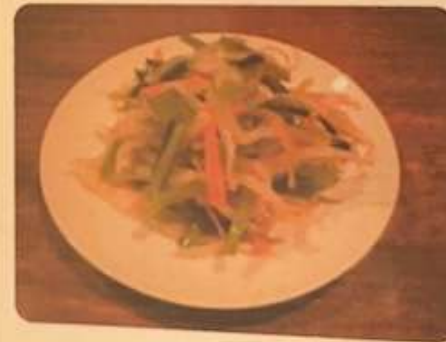
小松菜ともやしのあえ物 450円