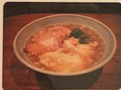
ワンタンチャーシューメン 1050円