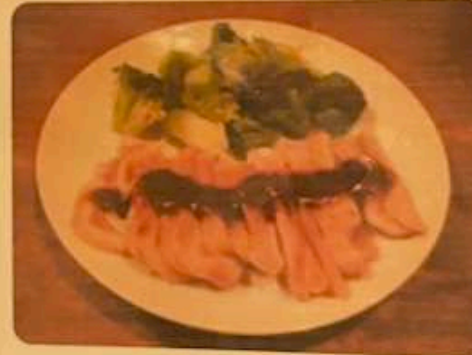
豚軟骨プラスワン 500円