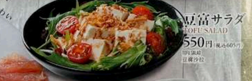
豆腐サラダ TOFU SALAD 550円 (税込605円) TOFU SALAD 豆腐沙拉