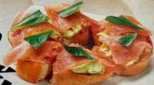
生ハムのブルスケッタ NAMAHAMNO BRUSCHETTA 650円 (税込715円) DRY CURED HAM BRUSCHETTA 生火腿烤面包