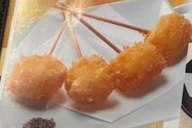
チーズフライ CHEESE FRY (炸芝士) 炸炸薯 500円 (税込550円)