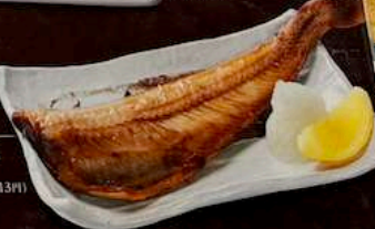
縞ホッケ SHIMA HOKKE 830円 (税込913円) GRILLED BAIT FISH 烤远东多线鱼