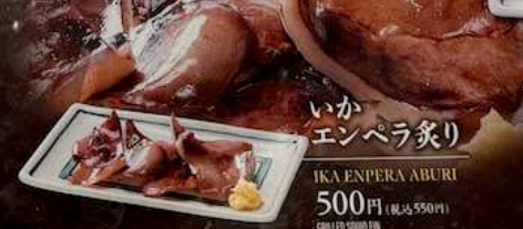
いかエンペラ炙り IKA ENPERA ABURI 500円 (税込550円) GRILLED SQUID FIN 烤乌贼鳍