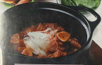
牛焼肉オンサーピーマン GVUYAKINIKU ON THE PIMAN 750円(税込825円) BEEF GREEN PEPPERS WITH SHALLOT BELL 牛肉包生青椒