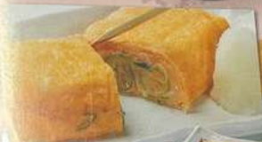
ギネギ玉子焼き INEGI TAMAGOYAKI DEEP-FRIED EGG WITH CHIPPED GREEN ONION 家常煎鸡蛋卷 540円 (税込594円)