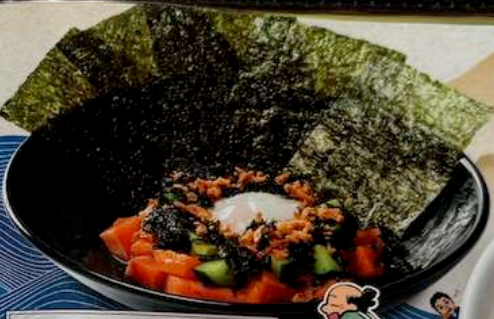
サーモンユッケ SALMON YUKHOE 790円 (税込869円) SALMON FILETS WITH HOT SPRING EGG 熟鸡蛋