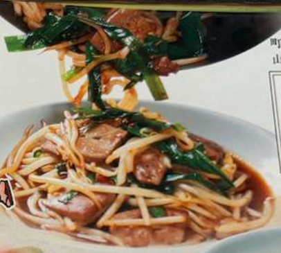
町中華の王道 山ちゃん特製ダレが肝。 レバニラ LIVER NIRA 700円(税込770円) STIR-FRIED LIVER AND LEEK 韭菜炒猪肝