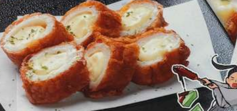
ちくちー揚げ CHIKU CHEE AGE CHIKUWA TEMPURA WITH CHEESE 炸竹筒奶酪 540円 (税込594円)