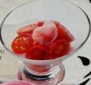
ガリトマト GARI TOMATO 400円 (税込440円) PICKLED GINGER AND CHERRY TOMATO 糖漬番茄