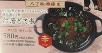
台湾どて煮 TAIWAN DOTO-NI 580円 (税込638円) 台湾炸酱面配炸炸猪肉 台湾炸猪肉