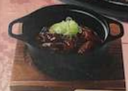
どて煮 DOTO-NI 500円 (税込550円) 台湾炸酱面配炸炸猪肉 台湾炸猪肉