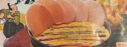
鉄板玉せん TEPPAN TAMASEN RED CHOCOLATE WITH EGG & MISO-GLAZE SAUCE & MILDLY ROASTED YAMACHAN STYLE 炒鸡蛋和米果 640円 (税込704円)