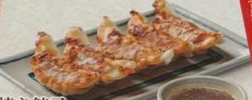
焼き餃子 YAKI GYOZA 焼餃子 460円 (税込506円)