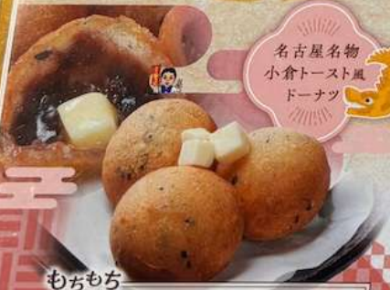
もちもち 名古屋名物 小倉トースト風 ドーナツ あんバター玉 AN BUTTER-TAMA ANKO INSIDE THE CHERRY AND TENDER FRIED DOUGH 软糖香脆的黄油球 500円(税込550円)