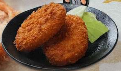
松阪牛入り 幻のゴショウ使用 山ちゃんコロッケ YAMACHAN CROQUETTE MATSUZAKA BEEF CROQUETTES 松阪牛炸肉饼 500円(税込550円)