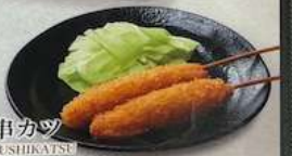
串カツ KUSHIKATSU DEEP-FRIED PORK SKEWERS 猪肉炸串 320円 (税込352円)