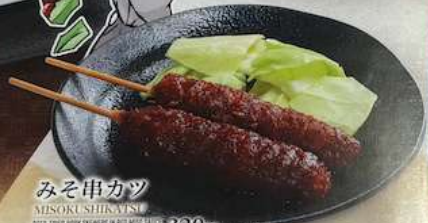
みそ串カツ MISO KUSHIKATSU DEEP-FRIED PORK SKEWERS IN RED MISO SAUCE 味噌炸猪肉配酱汁 320円 (税込352円)