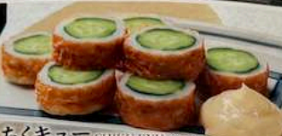
ちくキュー CHIKUKYU 430円 (税込473円) CHIKUWA WITH CUCUMBER 竹輪黄瓜