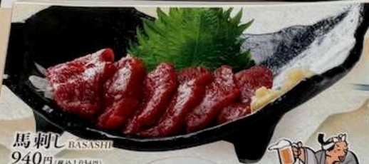
馬刺し BASASHI 940円 (税込1,034円) HORSE MEAT SASHIMI 马肉刺身