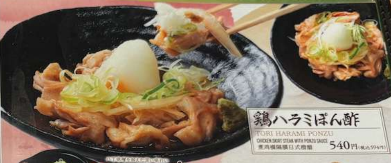
鶏ハラミぽん酢 TORI HARAMI PONZU CHICKEN SKEET STEAK WITH PONZU SAUCE 炸鸡横横日式醋醋 540円 (税込594円)