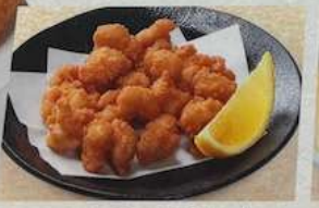
コリコリ軟骨唐揚げ KORIKORI NANKOTSU KARAAGE DEEP-FRIED CHICKEN CARILAGES 炸鸡软骨 530円 (税込583円)