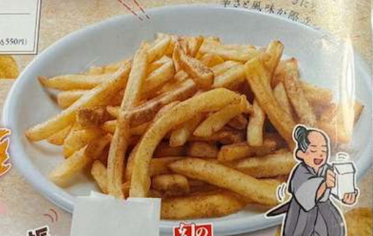
幻のゴショウ使用 フレ〜フレ〜ポテト 〜幻のゴショウ味〜 FUREFURE POTATO (MARBORONSHI PEPPER) 500円(税込550円) FRENCH FRY SPRINKLED WITH PHANTOM PEPPER 炸薯条(山将梦幻胡椒味道) 辛 HOT