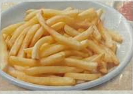
フライドポテト FRIED POTATO FRENCH FRY 炸薯条 430円 (税込473円)