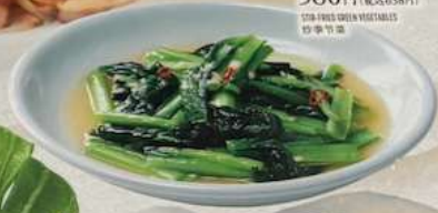
青菜炒め AONITAME 580円(税込638円) STIR-FRIED GREEN VEGETABLES 炒青菜