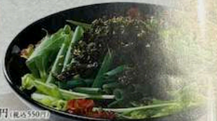
チョネギサラダ CHONEGI SALAD 500円 (税込550円) CHICKPEA SALAD WITH SMALL GREEN DRESSING 韩式沙拉