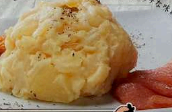
自家製ポテトサラダ JIKASEI POTATO SALAD 500円 (税込550円) HOMEMADE POTATO SALAD 山椒自製土豆沙拉