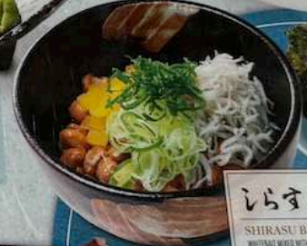
しらすバクダン SHIRASU BAKUDAN 580円 (税込638円) WHITEBAIT MIXED WITH RAITO 纳豆小炒干鱼菜