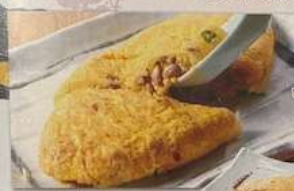
納豆オムレツ NATTO OMELET NATTO FENNYMILKED TOBEEAN OMELET 纳豆煎蛋 530円 (税込583円)