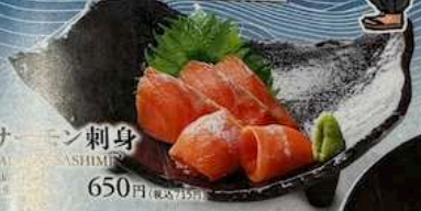
サーモン刺身 SALMON SASHIMI 650円 (税込715円) SALMON SASHIMI 鮭鱼