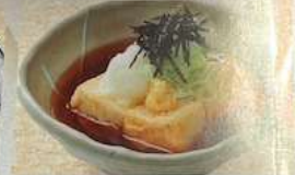
揚げ出し豆腐 AGEDASHI DOFU DEEP-FRIED TOFU IN JAPANESE-STYLE SAUCE 和風酱油煎豆腐 500円 (税込550円)