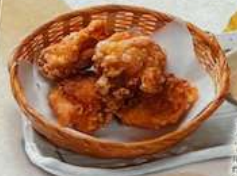
鶏もも唐揚げ TORIMOMO KARAAGE FREE CHICKEN WITHOUT BONE 炸鸡腿 640円(税込704円)