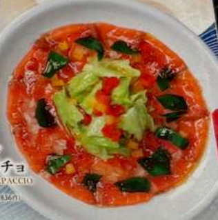
サーモンカルパッチョ SALMON CARPACCIO 760円 (税込836円) SALMON CARPACCIO 鮭鱼糖醋渍汁