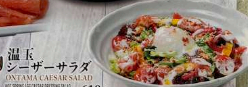
温玉 シーザーサラダ ONTAMA CAESAR SALAD 610円 (税込671円) HOT SPRING EGG CAESAR DRESSING SALAD 温泉沙拉配温泉蛋